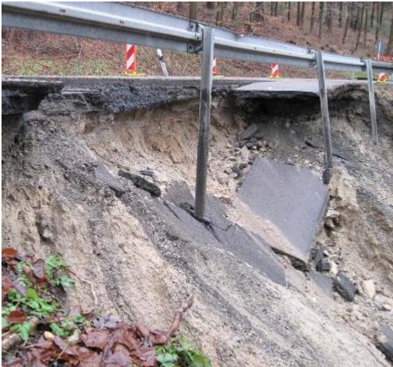
Rutschung an der K 1805 Murrhardt-Köchersberg