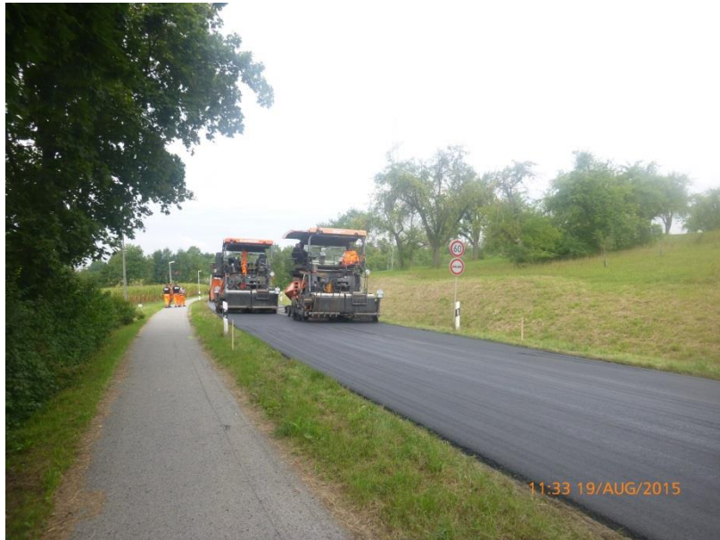
K 1847 Weiler zum Stein