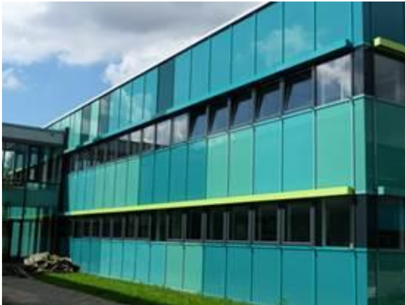
Fassadensanierung BSZ Backnang